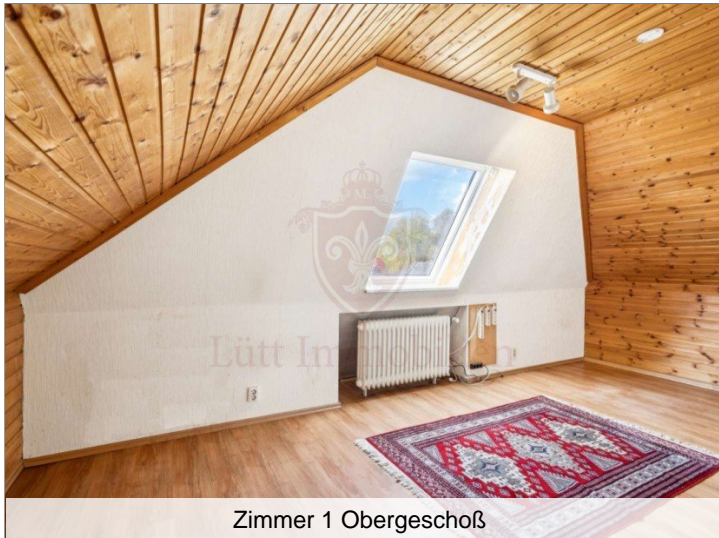
Zimmer 1 Obergeschoß