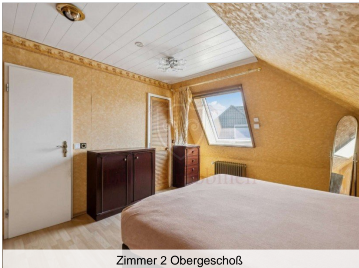
Zimmer 2 Obergeschoß