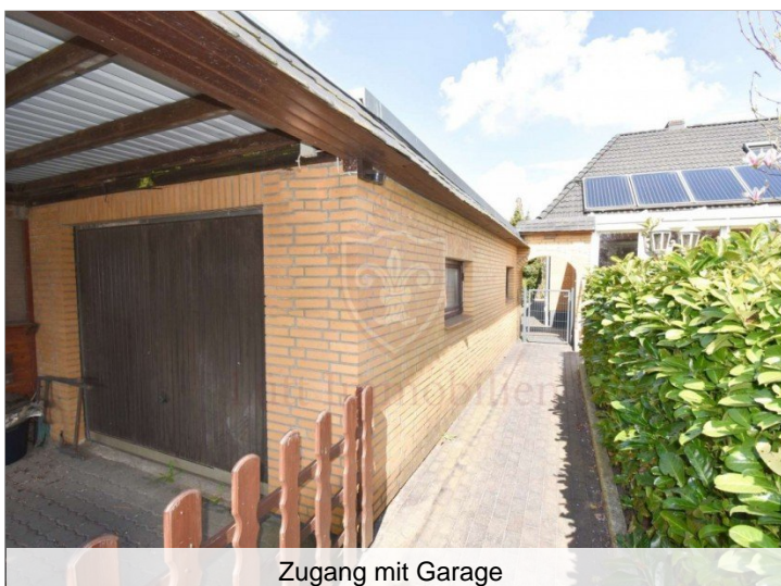
Zugang mit Garage